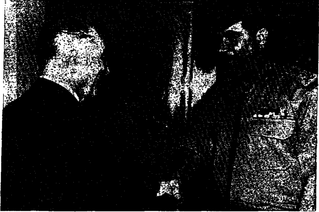
دولة الرئيس بهجت القطري يستقبل الفريق ابراهيم الداود وزير الدفاع العراقي « تصوير و. ا. ا. »

جلالة الملك العظيم يتحدث للسفير العراقي إبراهيم الداود وزير الدفاع العراقي بحضور سمو الأمير حسن ولي العهد العظيم والسفير العراقي في عمان . « تصوير و. ا. ا. »